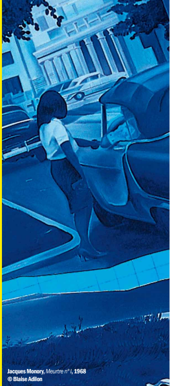
Jacques Monory, Meurtre n°1 , 1968

Ad Libitum, salon de curiosités Rue de la République PRIVAS