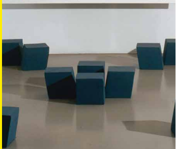
Franck Scurti, Le Calendrier , 1992